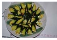
きゅうりの辛みそかけ 380円