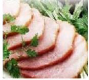
特製チャーシュー 480円