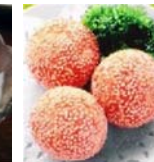
ごま団子 (3ヶ) 480円