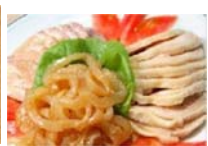
三種類の冷菜盛り合わせ 680円