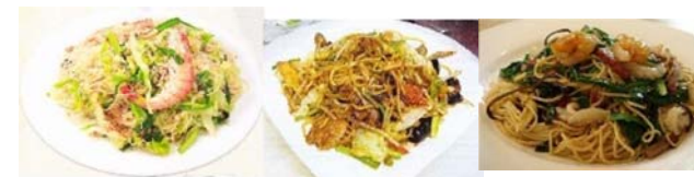
海鮮焼ビーフン 780円 肉と野菜焼きそば 780円 上海焼きそば 780円