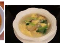
野菜の玉子スープ 580円