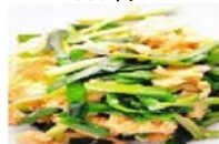
ニラ玉子家庭風炒め 680円