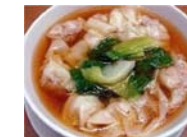
ワンタンスープ 580円