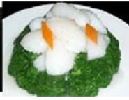
イカとブロッコリーの塩味 480円