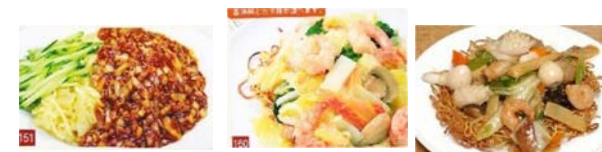
ジャージャー麺 780円 エビ焼きそば 780円 五目焼きそば 780円