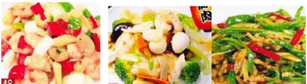
エビ、イカとアスパラ炒め 880円 八宝菜 780円 チンジャオロース 780円