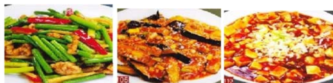
豚肉とニンニクの芽炒め 780円 ナスの中華味噌炒め 680円 マーボー豆腐 680円