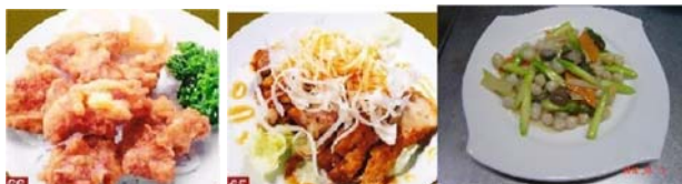
鶏のから揚げ 680円 油淋鶏 680円 アスパラと帆立炒め 780円