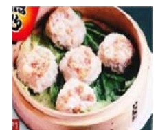
特製手作りシュウマイ (5ヶ) 480円