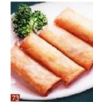
春巻(ハルマキ) (4本) 480