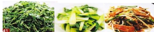
トウモロコシの炒め 680円 季節野菜炒め 680円 ニラレバー炒め 880円