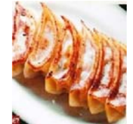
特製手作り焼きギョウザ (6ヶ) 480円