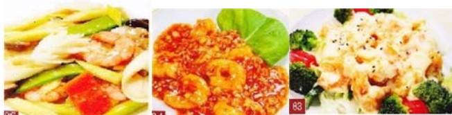
エビ、イカとアスパラ炒め 880円 エビチリソース 880円 エビのマヨネーズ炒め 780円