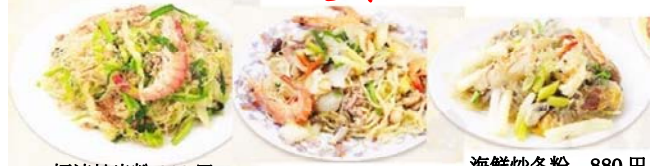
福清炒米粉 880円 海鮮炒麵 880円 海鮮炒冬粉 880円 福建焼きビーフン 海鮮入りそば煮込み 海鮮入り春雨炒め