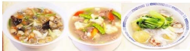
海蠣粉湯 880円 肉粉湯 880円 番薯丸 1000円 牡蠣入りとろみスープ 豚肉入りとろみスープ サツマイモ団子