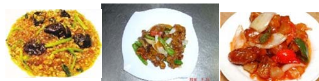
豚挽肉と春雨の煮込み 780円 黒酢豚 880円 酢豚 780円