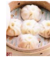
シウロンボウ (小籠包) (5ヶ) 480円