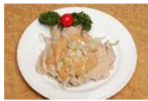
鶏肉のネギソースかけ 580円