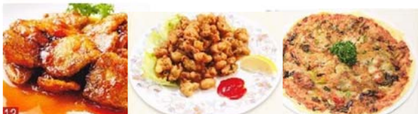
糖酢帶魚 980円 炸海蠣 880円 一品海蠣煎 780円 太刀魚の酢煮 牡蠣のから揚げ 牡蠣のお好み焼き