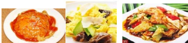
カニ玉 780円 豚肉キクラゲ玉子の炒め 780円 ホイコーロー 780円